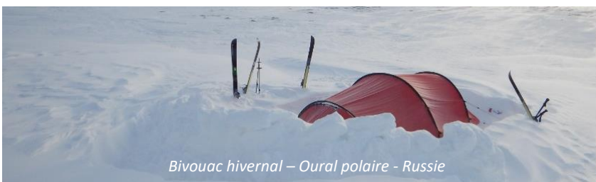
Bivouac hivernal – Oural polaire - Russie